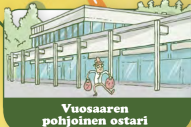
Vuosaaren pohjoinen ostari