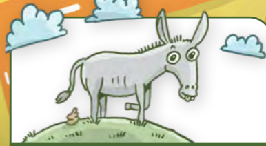
Aasi terrassitalojen luona