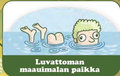
Luvattoman maauimalan paikka